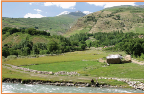
منظره ولایت بدخشان